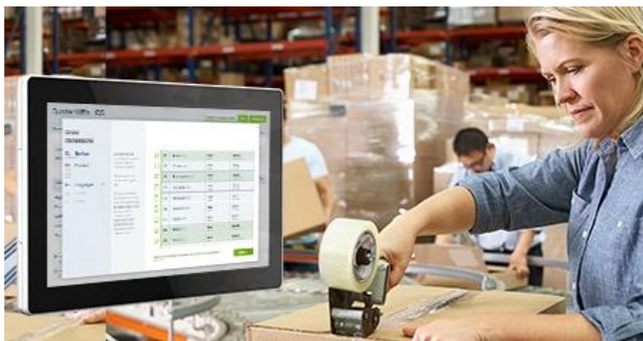
Терминалы упаковки и доставки товаров